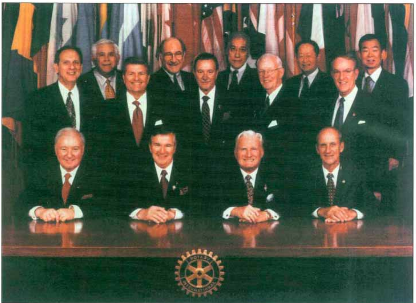
Директорите на Фондация Ротари за 1999-2000 година

Единайсет ротарианци получиха признание за своята изключително важна роля в програмата „Полио Плюс“. Наградите бяха връчени на Международния институт, който се състоя преди конференцията.