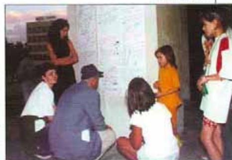
Пред Стената на пожеланията