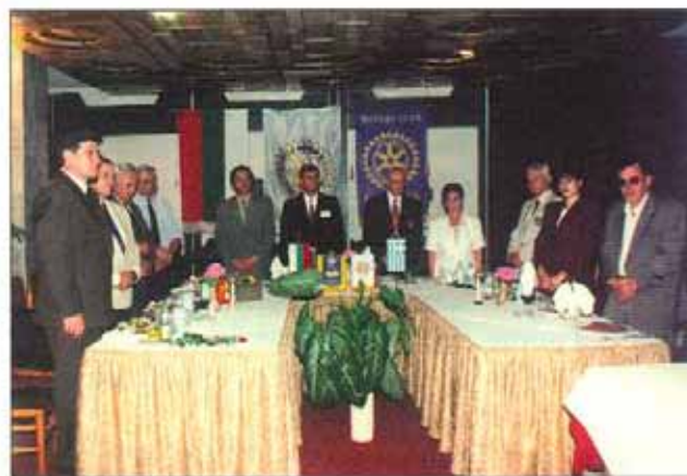
Официалните гости на церемонията