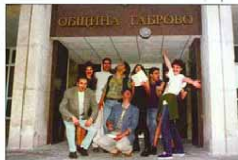
Организаторите са щастливи

Приятели, следвайте ротарианските си мечти!